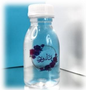
صورة (3) : ماء الورد

تم الحصول على ماء الورد النقي الناتج من عملية التقطير، حيث بلغت كمية المستخلص 500 مل، وزُعت في قوارير حجم 100 مل، كما هو موضح في (الصورة 3).