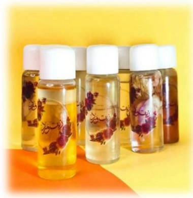
صورة (6): زيت ورد دون الحاجة لتثبيته