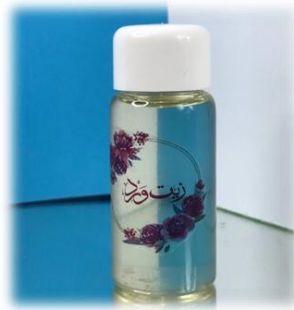
صورة (5) : زيت الورد و تثبيته في زيت ناقل

أما طريقة تثبيت الزيت في زيت ناقل فتتميز بأنها أقل تكلفة لأنها لا تتطلب كميات كبيرة من الأزهار، على الرغم من أن الزيت الناتج يكون أقل شفافية، لكنه معطر ويمكن استخدامه مباشرة، كما هو موضح في (الصورة 5 و6).