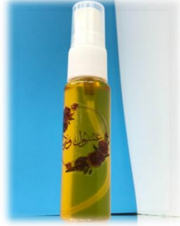
صورة (4): غسول الورد

تم استخدام طريقة التقطير وطريقة التسخين بالحمام المائي. نتج عن التقطير ماء ورد نقي، بينما أظهر المستخلص الناتج عن التسخين بالحمام المائي لوناً أحمر بسبب الصبغة. وبناءً عليه، تم اعتماد طريقة التسخين بالحمام المائي للحصول على مستخلص يمكن استخدامه كمنتج طبيعي لتحسين وإنعاش البشرة، كما هو موضح في (الصورة 4).